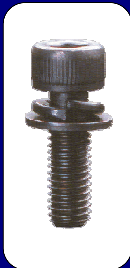
ばね座金・平座金組込 API-3・APJ-3